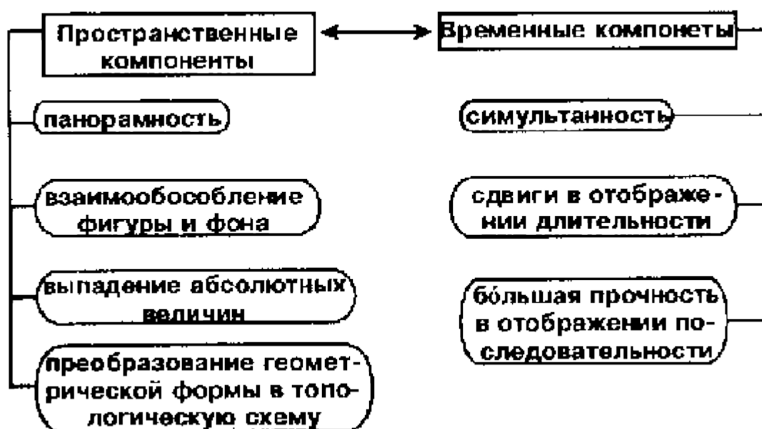
Схема 8. Пространственно-временная структура вторичных образов